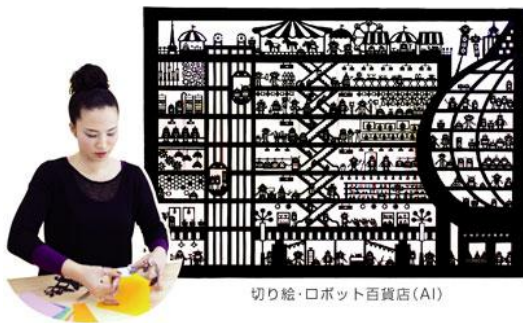
切り絵・ロボット百貨店(AI)