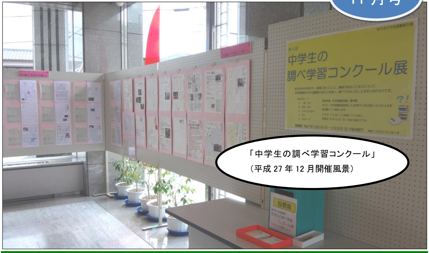
「中学生の調べ学習コンクール」 (平成 27 年 12 月開催風景)