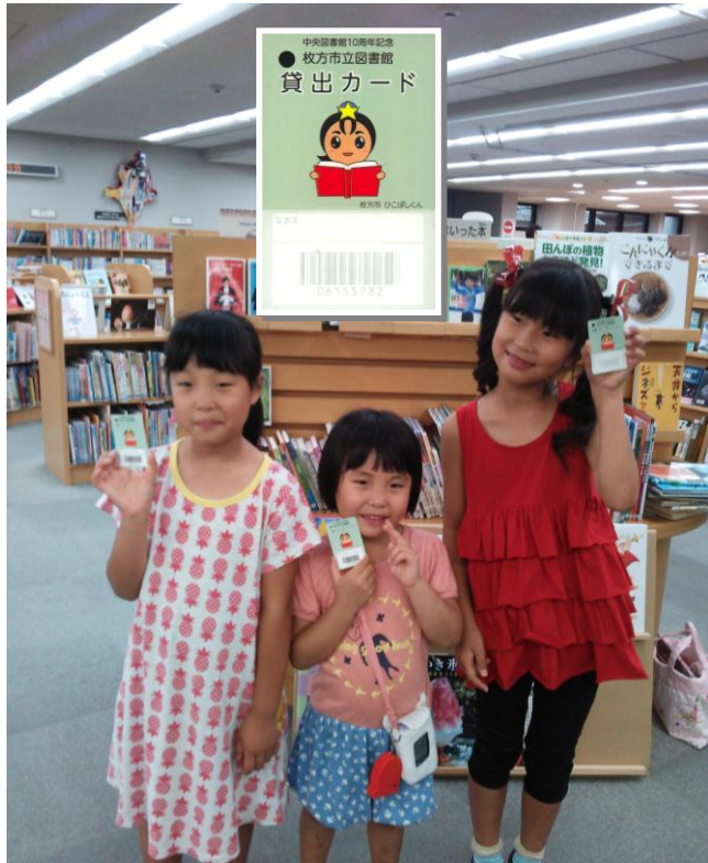
「ひこぼしくん」カードと子どもたち。中央図書館にて。

〒573-1159 枚方市車塚 2-1-1 TEL 050-7105-8141(代) FAX 072-851-0962