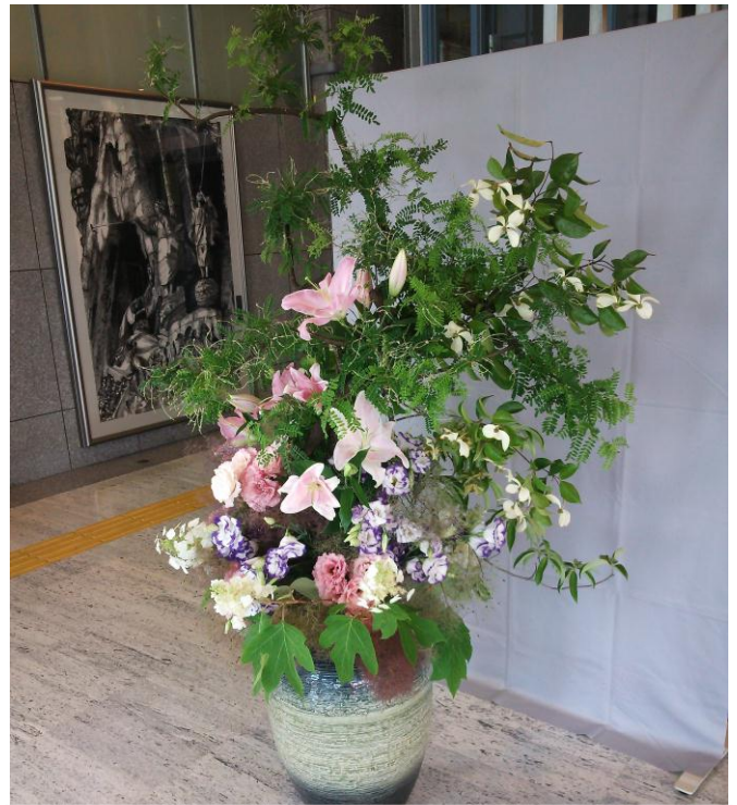
薬草いけばな展（ソフォラ、ヒマラヤママボウシ、トルコ桔梗、百合、カシワバ紫陽花、ケムリソウ他）