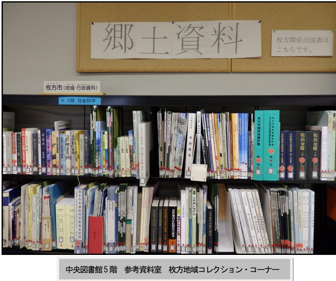
中央図書館 5 階 参考資料室 枚方地域コレクション・コーナー

〒573-1159 枚方市車塚 2-1-1 TEL 050-7105-8141(代) FAX 072-851-0962