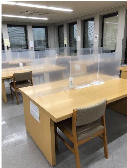
中央図書館 5階 参考資料室の様子

枚方市立図書館では、新型コロナ対策として、パーティションや空気清浄機、サーキュレーター、図書消毒器を設置し、返却本は除菌液で拭いています。