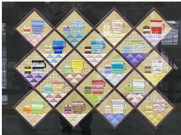
2021年2月のディスプレイの様子

中央図書館正面2階で皆さんをお出迎えるディスプレイ作品です。毎月中央図書館のボランティアさんがきれいに飾り付けをしてくださっています。