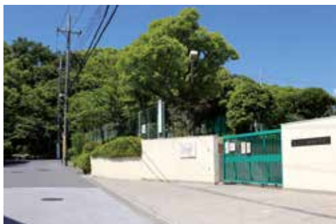
▲楠葉中学校の奥に見えるのは交野天神社の森だよ。

ところで中学校は「楠葉」で小学校は「樟葉」と、漢字が違うのはどうしてか知ってる? 明治22年、楠葉村と船橋村が合併して誕生したのが「樟葉村」なんだ。「日本書紀」に登場する「樟葉」にちなんだんだって。楠葉村の人が船橋村の人に気を使ったのかな? 樟葉村は昭和13年に枚方町と合併するまで50年間続き、その間にできた樟葉小学校や樟葉駅には「樟」が使われたんだ。枚方町と合併して樟葉村がなくなった後にできた中学校などには「楠」の字が使われているんだけど、小学校は「樟」の字に統一されているんだよ。