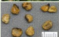
チ ョ ウ セ ン ア サ ガ オ の 種