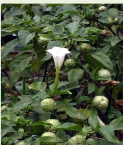
チ ョ ウ セ ン ア サ ガ オ の 葉 と 花