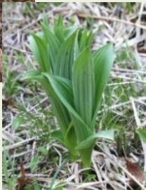
芽 出 し 期 の コ バ イ ケ イ ソ ウ