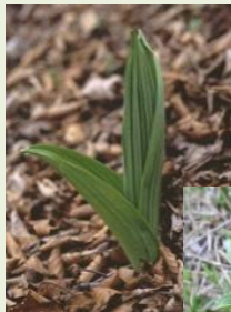
芽 出 し 期 の バ イ ケ イ ソ ウ