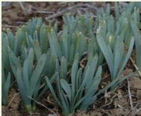
ス イ セ ン