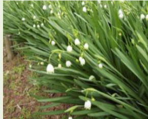
ス ノ ー フ レ ー ク （ ス ス ラ ン ス イ セ ン）