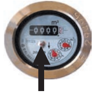
パイロットマーク

なお、道路上での水漏れや不明な湧水を発見したときは、上下水道局お客さまセンターへ。