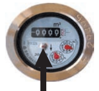
パイロットマーク

なお、道路上での水漏れや不明な湧水を発見したときは、上下水道局お客さまセンターへ。