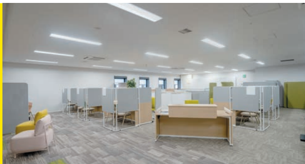
市民窓口センターでは申請書を書かない新しいカタチの窓口を導入しています

ステーションヒル枚方の5・6階に市民窓口センターやまるっとこどもセンター、男女共生フロア・ウィル、消費生活センター、市駅前図書館、生涯学習交流センターなど市役所関係の施設が集約。手続きや子どもの健診のついでに図書館やウィルで本を借りたり、ショッピングモールで買い物したりできるようになりました。生涯学習交流センターでは各種イベントも開催しています。