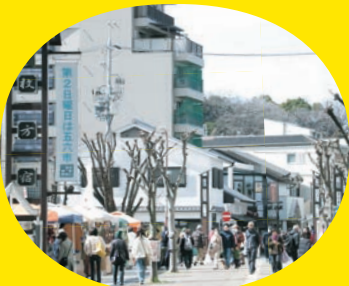
五六市開催時の枚方宿。一日に約8,000人が訪れます。