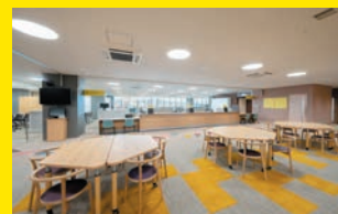
まるっとこどもセンター 男女共生フロア・ウィル交流スペース