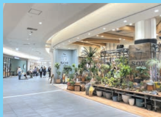
営業面積約72,000㎡の府下最大級のモール。