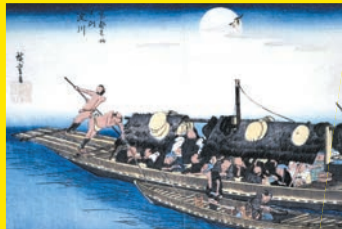
歌川広重「京都名所之内 淀川」