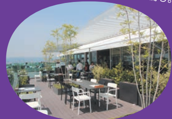
◀京阪電鉄枚方市駅降りてすぐに見える幻想的な光景に目を奪われます。