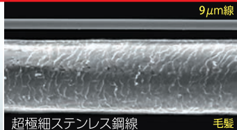
超極細ステンレス鋼線