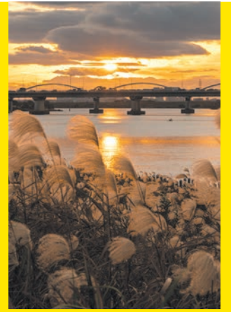
枚方八景のひとつ「淀川の四季」(秋)