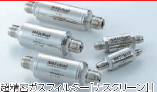
「超精密ガスフィルター」[ナスクリン]

太陽電池パネル製造に使用される、超極細ステンレス鋼線を始めとし、スマートフォンや家電製品、自動車などで使われる“ばね”や“ネジ・ボルト”の素材となるステンレス鋼線や、その加工技術から生まれた金属繊維「ナスロン」、高集積半導体製造装置に欠かせない超精密ガスフィルター「ナスクリン」を製造・販売しています。