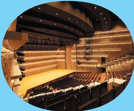
総合文化芸術センター関西医大 大ホール。 1階から3階までの総客席数は1468席。