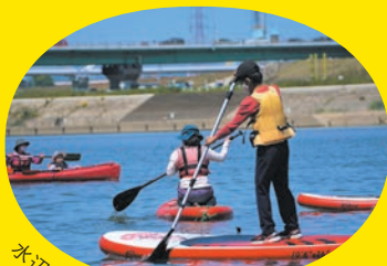
水辺空間の活用が進んでいます。

着場一天満橋・八軒家浜船着場間ではクルーズ船が定期運航しており、江戸時代に栄えた淀川の舟運を体験することができます。春夏秋冬さまざまな装いを見せる淀川の景色は枚方八景のひとつにも選ばれています。