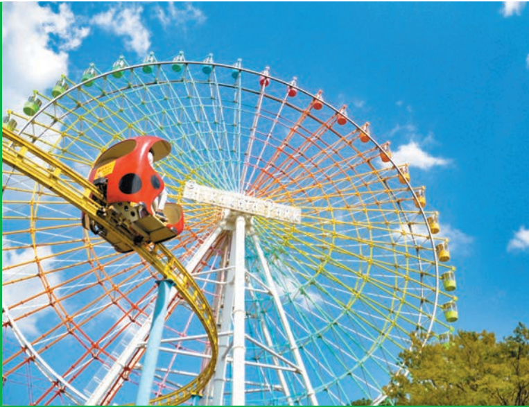
枚方の様々なところから見える大観覧車は市民にとって自慢のまちのシンボル。