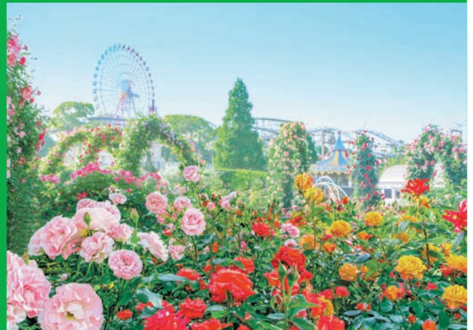
ローズガーデンでは春と秋に600種4000株のバラが咲き誇ります。