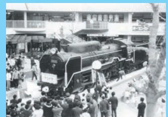
以前はSLのD51形を展示した汽車の広場が有名でした。