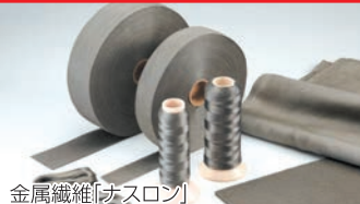
金属繊維「ナスロン」