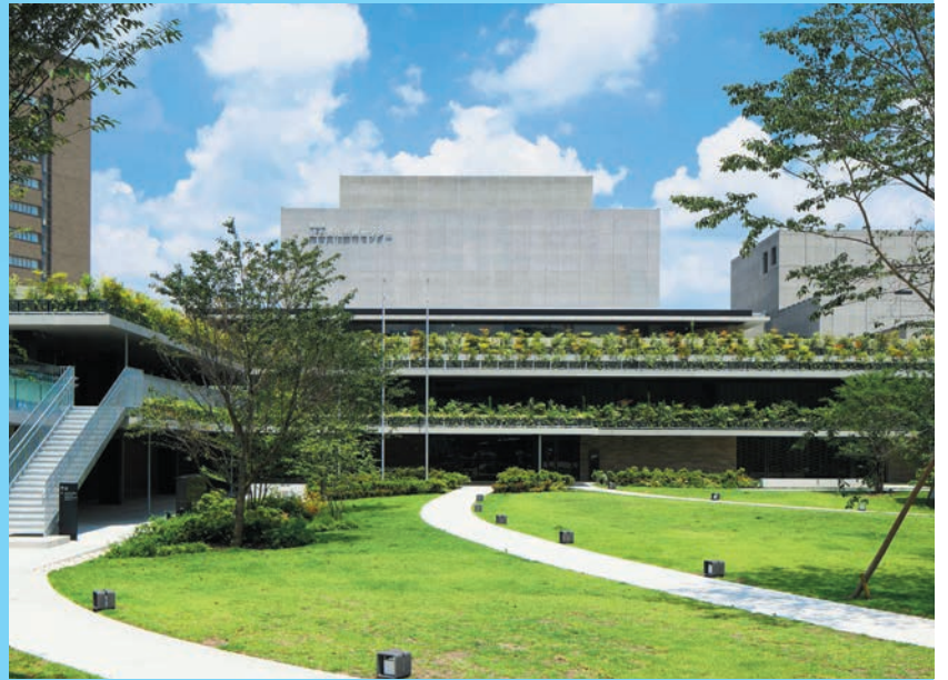
枚方市駅すぐの正面入り口。