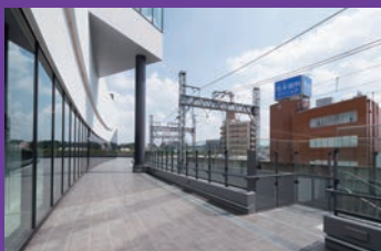
京阪電車を真横に望めるでんしゃみち