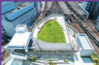
ひらかたデルタはまちを回遊する人々がほっと一息つける開放的な空間