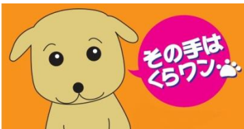
ひらかた観光大使「くらわんこ」 ©枚方文化観光協会

相談専用電話 (枚方在住・在職・在学) 072-844-2431 祝日除く平日 9時30分～16時30分