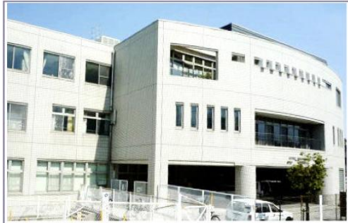
牧野生涯学習市民センター