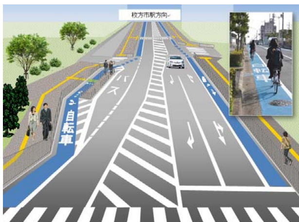
枚方藤阪線（天津橋工区）完成イメージ

26年度は、防災機能を兼ね添えた（仮称）東部スポーツ公園の一部開設と安全で快適な交通体系の軸となる枚方藤阪線の計画的な整備を進めます。