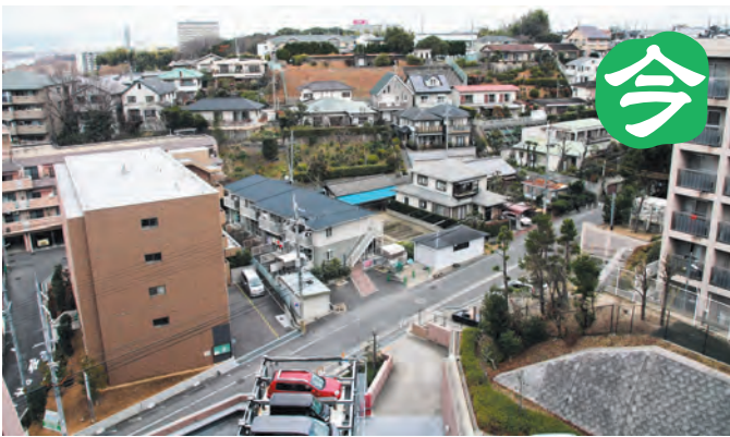
◀道路手前から広がる敷地に万里荘がありました（伊加賀北町）。