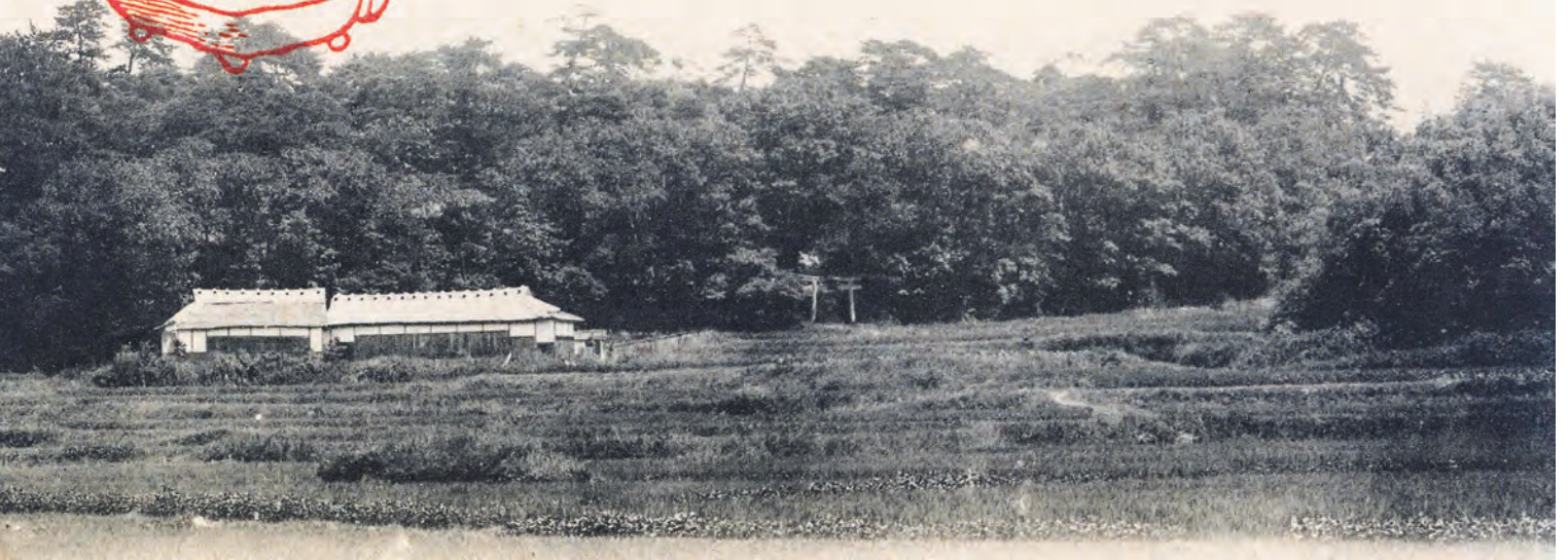
▲明治時代の絵はがき。駅鈴をデザインしたスタンプが押されています。森のように見えるのは小高い丘で、その先は枚方村（現在の枚方元町）です。