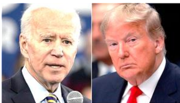
バイデンさん トランプさん