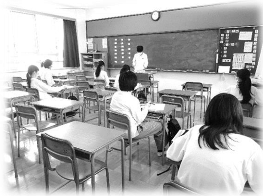
自己紹介クイズ…楽しそう♪

6月1日の分散登校から2週間経ちました。クラスの半分としか会えない状況ですが、メッセージボードを活用したりして、クラス交流をしています。特活の時間には、自己紹介などおこないました。