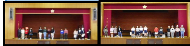
工夫を凝らした6年生の出し物