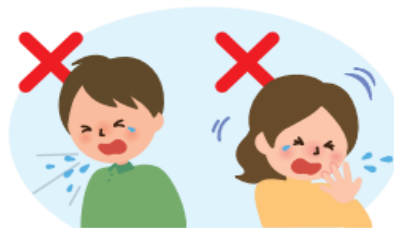
何もせずに咳やくしゃみをする 咳やくしゃみを手でおさえる