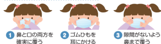
1 鼻と口の両方を確実に覆う 2 ゴムひもを耳にかける 3 隙間がないよう鼻まで覆う