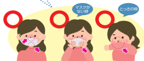
マスクを着用する (口・鼻を覆う) ティッシュ・ハンカチで口・鼻を覆う 袖で口・鼻を覆う