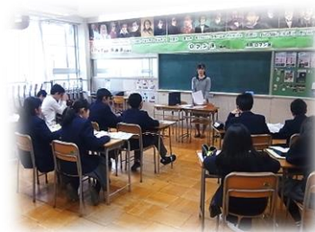
アナウンサーさん