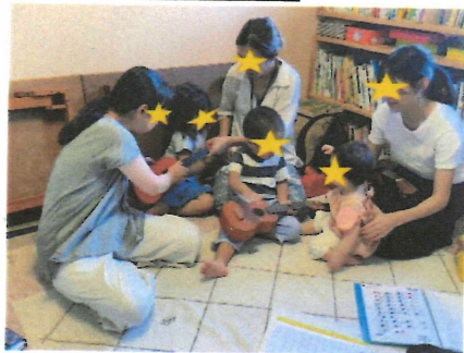
ウクレレの弾き方をレッスン中