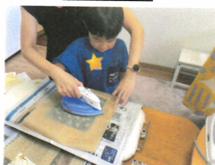
エコラップ講習会