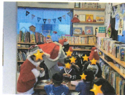
クリスマスイベントの製作