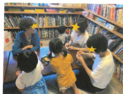
高齢者とのふれあい