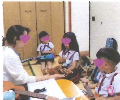
ウクレレの弾き方をレッスン中