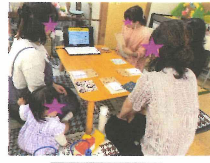
エコラップ講習会