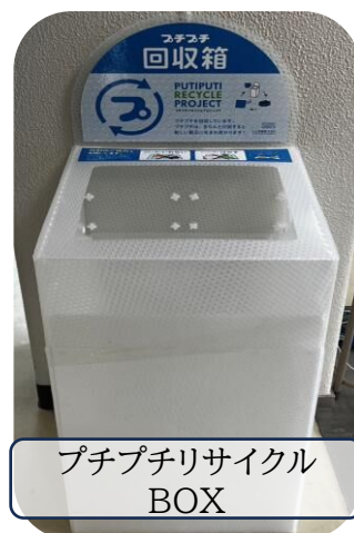
プチプチリサイクル BOX