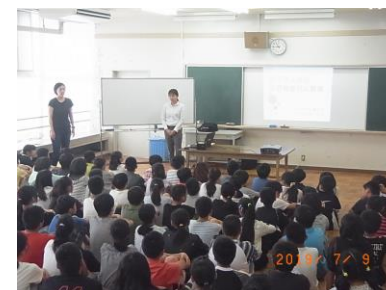
6年 非行防止教室の様子