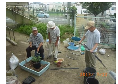
地域の方の菊作りの様子