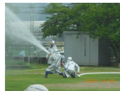
地区防災訓練の様子

※体育館が床の張替え工事のため、展示場所が例年と変更になります。 夏休み明けの次号(第6号)でお知らせいたします。