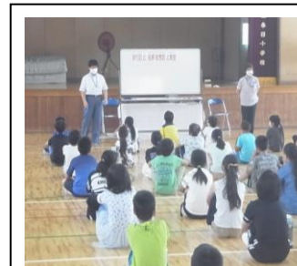
5年生 非行防止教室の様子