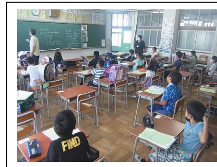
放課後自習教室の様子