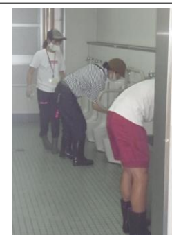
PTA・地域の トイレ掃除の様子

※新型コロナウイルス感染症により、日々状況が変化しているため、必要に応じて変更が生じる場合があります。その際には、「春日メール(ミルメール)」でお知らせいたします。