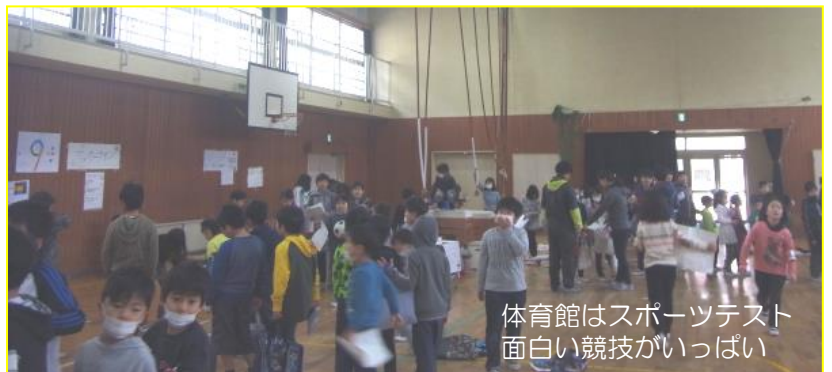
体育館はスポーツテスト 面白い競技がいっぱい