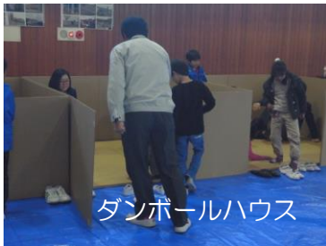
ダンボールハウス