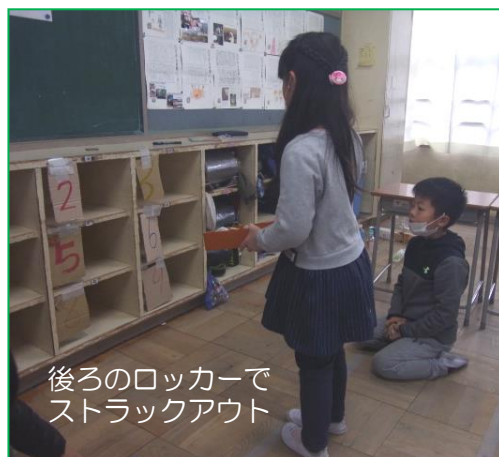
後ろのロッカーで ストラックアウト