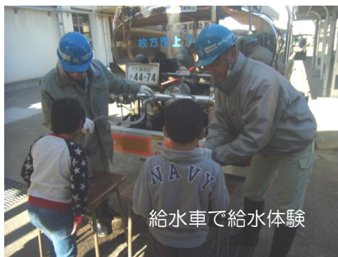
給水車で給水体験