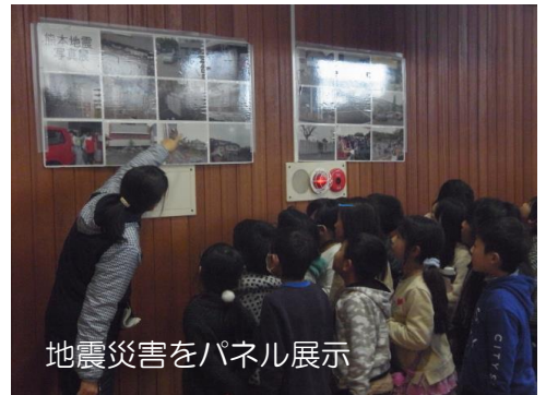
地震災害をパネル展示