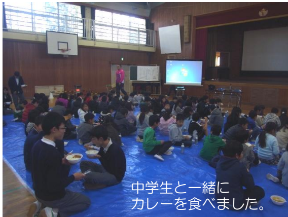
中学生と一緒にカレーを食べました。