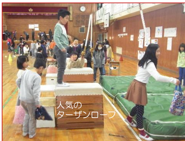
人気の ターザンロープ