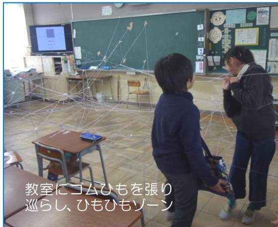
教室にゴムひもを張り 巡らし、ひもひもゾーン

先週末に引き続き午後から雪との予報が出ていた 20 日、子どもたちが楽しみにしていた“児童会祭り”が行われました。今年も 3 年生以上の各クラスが、自分たちで企画制作したゲームやお化け屋敷、それにスポーツテストなど様々な出し物を、教室や体育館を使って開催しました。寒さを忘れ、子どもたちは大いに楽しみました。