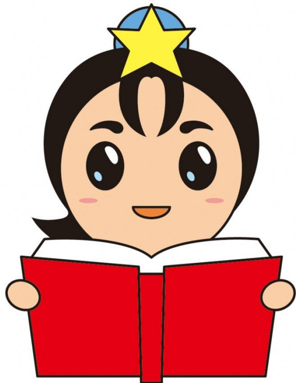
枚方市産業振興キャラクター ひこぼしくん