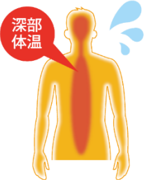
深部体温上昇 脱水 (高体温)