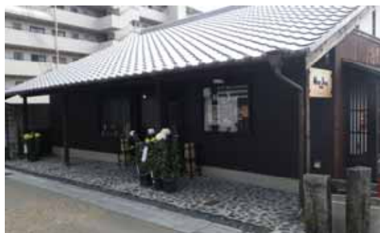
歴史景観に調和した 旧枚方宿のレストラン