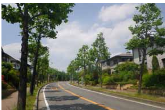
北山地区の緑豊かなまちなみ

また、住民の合意による景観協定、建築協定等の法律に基づいた協定の締結や、景観づくりの自主的な協定等の締結などを推進し、市民・事業者が自主的に取り組む景観づくりを推進します。