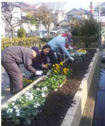
公園アダプトプログラムによる美化活動 (翠香園ふれあい公園)