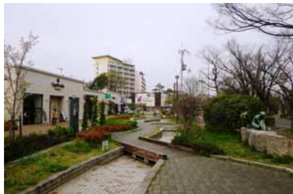
香里こもれび水路