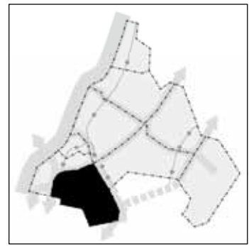
南部景観区域 区域現況図

今後、大規模な建て替えが推進中である香里団地を中心に、緑豊かで快適な住環境を育成するとともに、人々のふれあいを生みだす新たな商業・都市機能の充実を図ることが求められています。