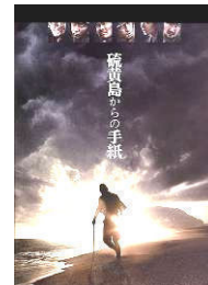
平和ナイトシアター