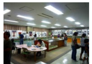
ヒロシマ・ナガサキ原爆パネル展