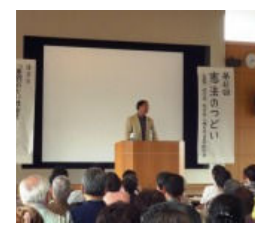
憲法のつどい講演会