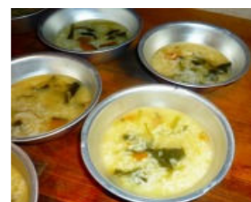
夏季 戦時食体験・試食会