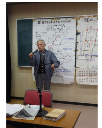
戦争体験語り継ぎ