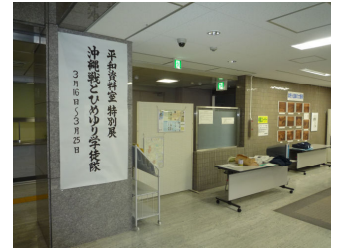
沖縄戦とひめゆり学徒隊