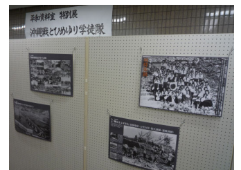
沖縄戦とひめゆり学徒隊