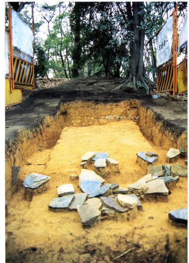
79 牧野車塚古墳墳丘テラス葺石出土状況