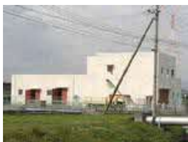
出口汚水中継ポンプ場(出口6丁目)