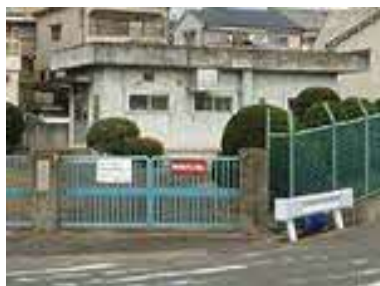
長尾家具町汚水中継ポンプ場(長尾家具町4丁目)