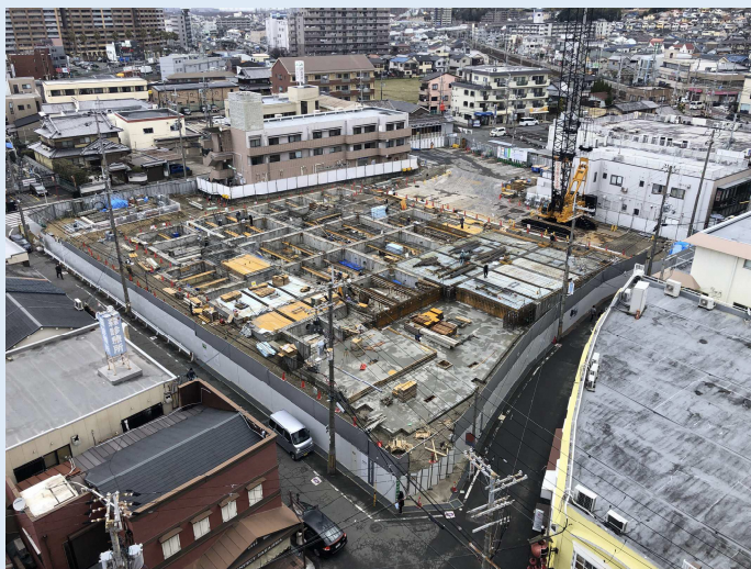
■ 光善寺駅西地区 第一種市街地再開発事業