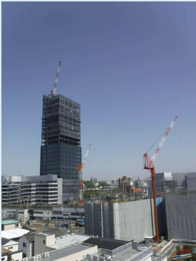
■ 枚方市駅周辺地区 第一種市街地再開発事業