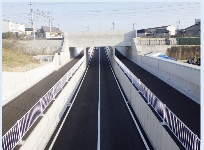
■ 都市計画道路「牧野長尾線」