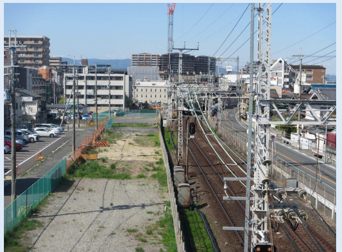
■ 京阪本線 連続立体交差事業