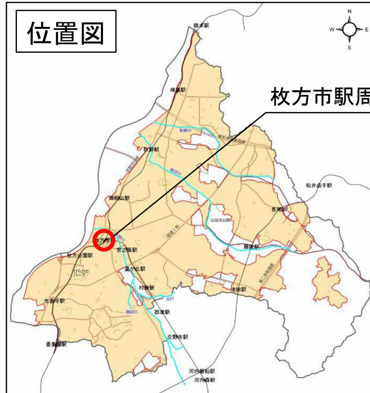
枚方市駅周辺地区