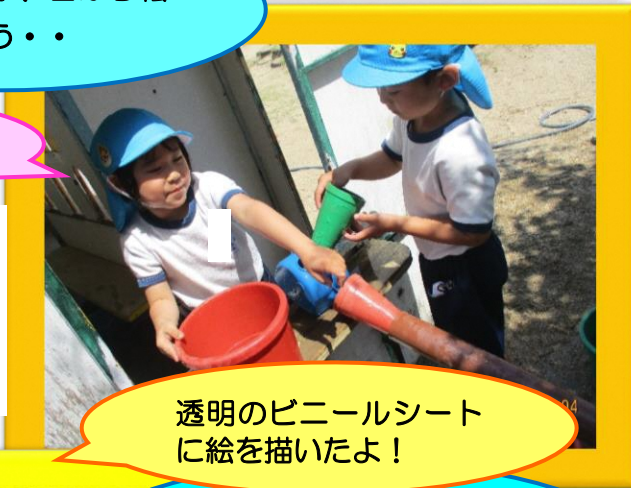
透明のビニールシートに絵を描いたよ！

砂・水・泥などの感触を存分に味わいながら、物の変化や特性に気付いたり、自分なりに予想を立ててみたことを試したり・・・そんな日々の遊びが、「知りたい」「学びたい」という意欲につながってほしいと願っています。