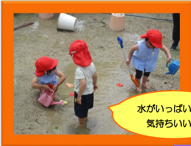
水がいっぱい！ 気持ちいいね！

水や裸足が心地よくなる季節。砂場で水を使ってダイナミックに遊んだり、泥団子づくりをしたり、五感をつかっていっぱい遊びました。心地よさ、楽しさを存分に味わいながら、様々なことを試し、気づきや発見もたくさんありました。