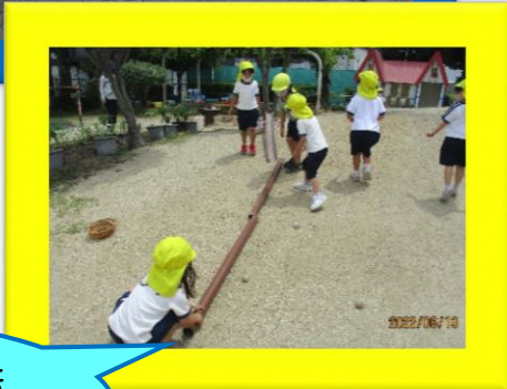
作った泥団子、山から転がしてみよう・・・