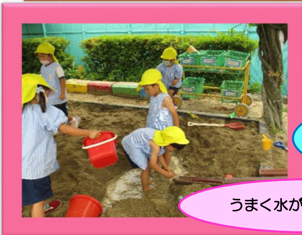
うまく水が流れそう！

砂・水・泥などの感触を存分に味わいながら、物の変化や特性に気付いたり、自分なりに予想を立ててみたことを試したり・・・そんな日々の遊びが、「知りたい」「学びたい」という意欲につながってほしいと願っています。