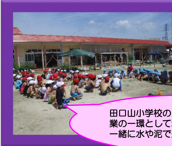
田口山小学校の1年生が、生活科の授業の一環として幼稚園に来てくれて、一緒に水や泥で遊びました。