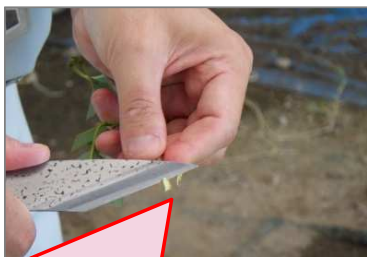
根になる部分 吸水しやすいように広めに切る