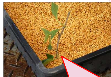
切口に発根促進剤を付け 用土に挿す