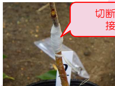
切断面同士 接着中