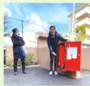
屋外消火器の使用説明