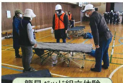
簡易ベッド組立体験