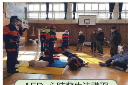
AED・心肺蘇生法講習