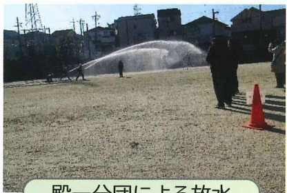
殿一分団による放水