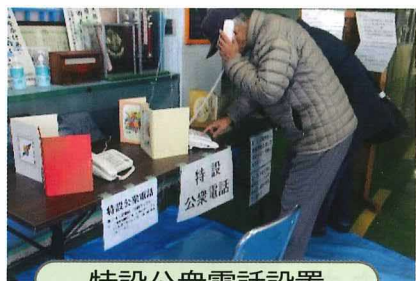
特設公衆電話設置