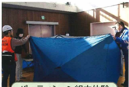
パーティション組立体験