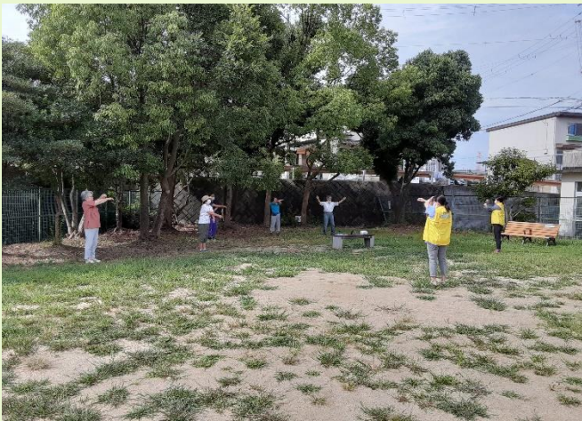
第1・第3木曜 ちびっこ広場