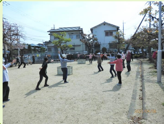
第2・第4木曜 藤阪公園