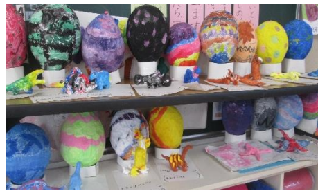
2年生 恐竜のたまご