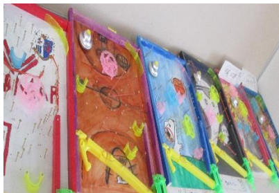
4年生 コリントゲーム