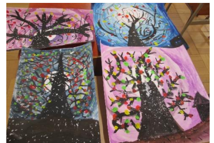
3年生 モチモチノキ