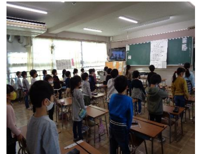
各クラスで「平和の鐘」を歌いました