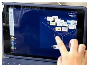
Yチャート。自分の考えを分類します