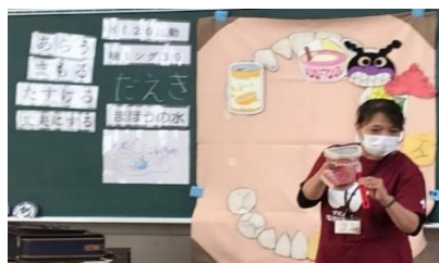
虫歯にならないために歯磨きをしっかりと

枚方市の歯科衛生士会の方に来ていただき、11月17日(火)1,4年生にブラッシング指導をしました。虫歯や歯周病にならないために気を付けることや、歯の磨き方、「80歳になっても20本以上自分の歯を保とう」という「8020運動」の事などを楽しく教えていただきました。