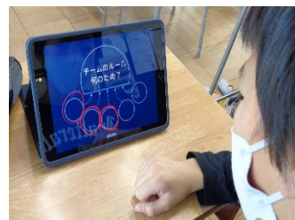
クラゲチャート。しっかり考えています