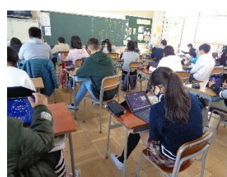
みんな真剣に取り組んでいます