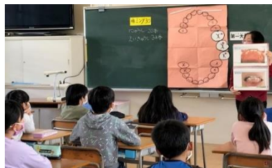
歯の健康についてしっかり学びました

まいにちどくしょ がっきしめきり 「毎日読書」の2学期 め 切は12月11日(金)です。