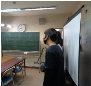
6年生が放送室から報告

11月27日（金）全校集会の時に、6年生が全校児童へ、その千羽鶴のお礼と学習したことの報告会をしました。新型コロナウイルス感染症対策のため全校児童集まらず、各クラスでの放送集会でした。報告のあと、全校で「平和の鐘」という歌を放送に合わせて歌い、学校中に美しい歌声が響きました。