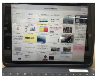
ロイノートを使ってまとめ、提出