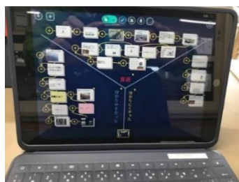
みんなの考えを交流、 ほかの人はどう考えたかな