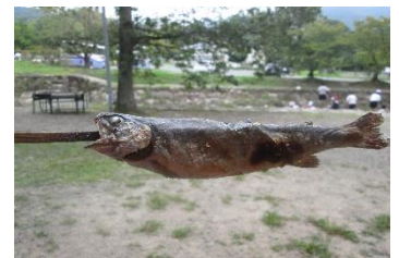
取った魚を焼いて