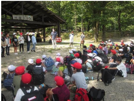
マキノ高原到着、入村式

9月24日(木)5年生は校外学習でマキノ高原へ行ってきました。お天気に恵まれ、楽しい1日となりました。