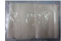
←布マスク 受領書& ↓図書カード

布マスク1枚は、1日一回の洗濯により1か月使用可能のものとなっております。図書カードは、白い氏名入りの封筒に入れて配布しております。従来の小さなカードではなく、QRコードの入ったA4サイズのネットギフトのプリントとなっております。お持ち帰りの際に、保護者の方で中身をご確認の上、同封の受領書に署名していただき次回登校時に児童に持たせてくださいますようお願いいたします。