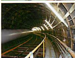
シールド工法による雨水管整備工事の様子（写真は整備済の山田雨水幹線）

昨年 8 月の大雨により、本市では観測史上最多となる 1 時間降水量 108.5mm を記録するなど、市内の広い範囲で浸水被害が発生しました。