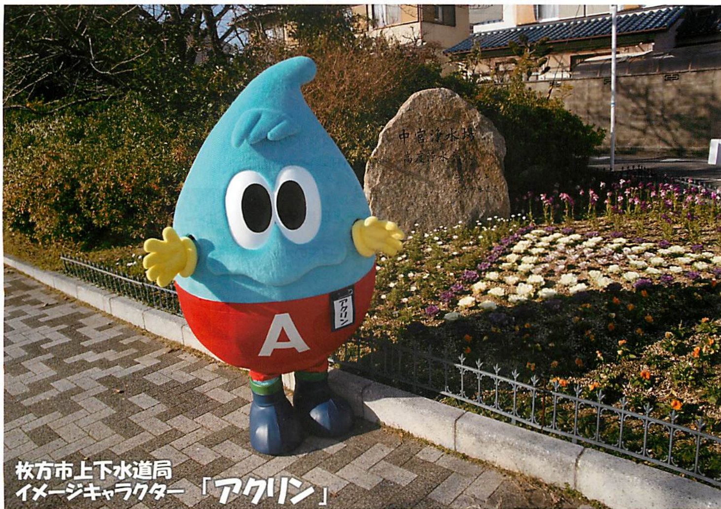
枚方市上下水道局 イメージキャラクター「アクリン」

「Water 通信」は、上下水道局が取り組んでいる事業の内容や水に関する情報を広く紹介するための情報誌です。昨年までは「WATER WORKS (ウォーターワークス)」として市民の皆さんにお届けしていましたが、下水道部との組織統合に伴い「Water 通信」として生まれ変わりました。今後、さらに内容を充実させ、随時発行していきますので楽しみに！