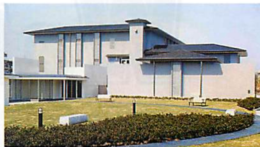
高度浄水施設の外観

本市の上下水道事業を取り巻く環境の変化や新たな課題にも的確に対応し、次世代に安心して引き継いでいける施設のあり方や、健全な事業経営を進めるための基本的な方向性を示すために「枚方市上下水道ビジョン」の策定を進めています。