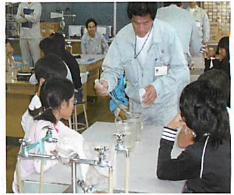
凝集剤（PAC）を使った実験。水に含まれているにごりが固まる様子を観察します。