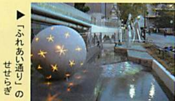
「ふれあい通り」の 水再生施設