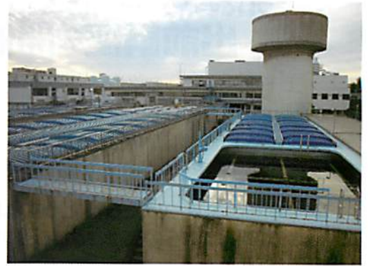
中宮浄水場内のろ過池と沈殿池。水中のごみやにりを取り除きます。

また、水道水を安心して飲んでいただくために、水質検査計画を作成し、水源から蛇口まで、きめ細かな水質検査を実施しています。