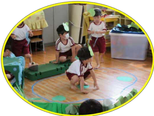
ケロケロ！ ここはカエルの池だよ！