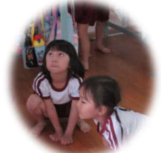
みたり知ったり感じたりしたことを、すぐに表現できるのは、幼児期ならでは！！