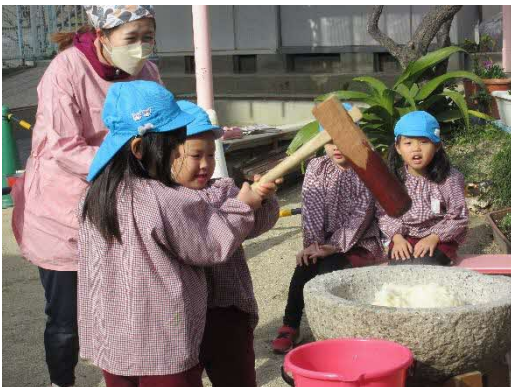
5歳児のみんなが大活躍！