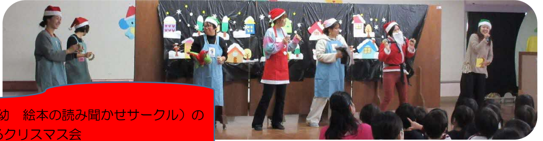
『バオバブ』（枚方幼 絵本の読み聞かせサークル）のお母さんたちによるクリスマス会