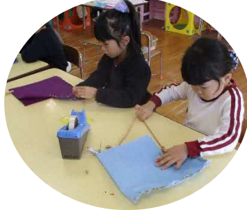
サンタさんがきてくれますように…