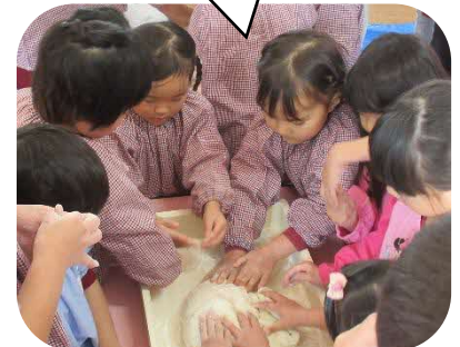
つきあがった餅で鏡餅づくり