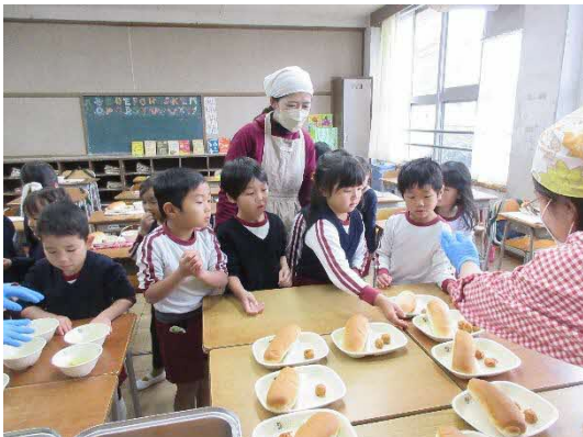
小盛り・中盛り・大盛り…自分で食べられる量を真剣に選り中…