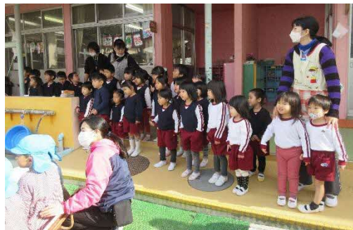
3・4歳児もみんなで大活躍！