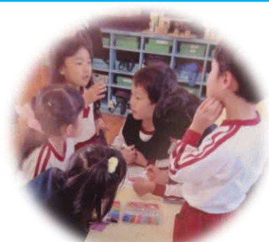
自分のつくりたいゲーム屋さんにかかれて、相談・作成開始!