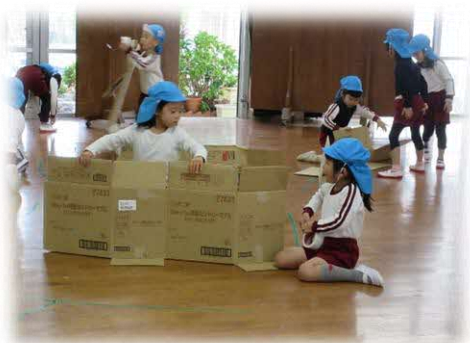
段ボールカッターと養生テープを手に、道づくりが始まり、あっという間に遊戯室が迷路になりました!

運動会を終え、満足感をいっぱい味わった5歳児の子どもたちは、「迷路の中にいろんなゲームがあることにしよう!」「秋でいっぱいしたらどう?」と、やる気いっぱい!!ゲームランドづくりが始まりました。