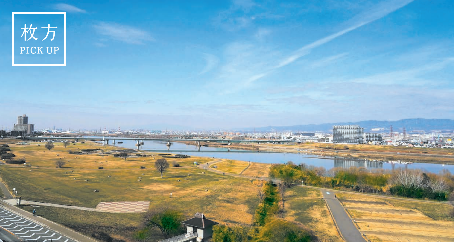
水辺から空まで突き抜けた景色の傍にある河川公園で体を動かして心身ともにリフレッシュ。