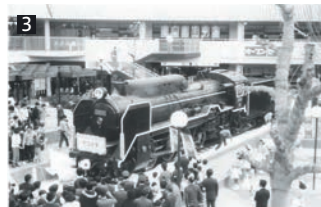
①KUZUHA MALL外観。②営業面積約72,000㎡の府下最大級のモール。③以前はSLのD51形を展示した汽車の広場が有名でした。