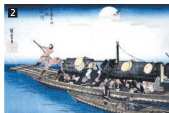
①五六市開催時の枚方宿。一日に約8,000人が訪れます。 ②歌川広重「京都名所之内 淀川」