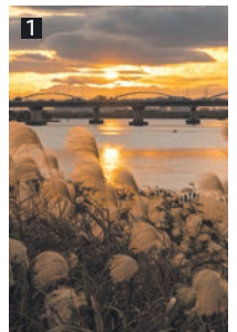
①枚方八景のひとつ「淀川の四季」(秋) ②水辺空間の活用が進んでいます。

ます。また、枚方船着場一夫満橋・八軒家浜船着場間ではクルーズ船が定期運航しており、江戸時代に栄えた淀川の舟運を体験することができます。春夏秋冬さまざまな装いを見せる淀川の景色は枚方八景のひとつにも選ばれています。