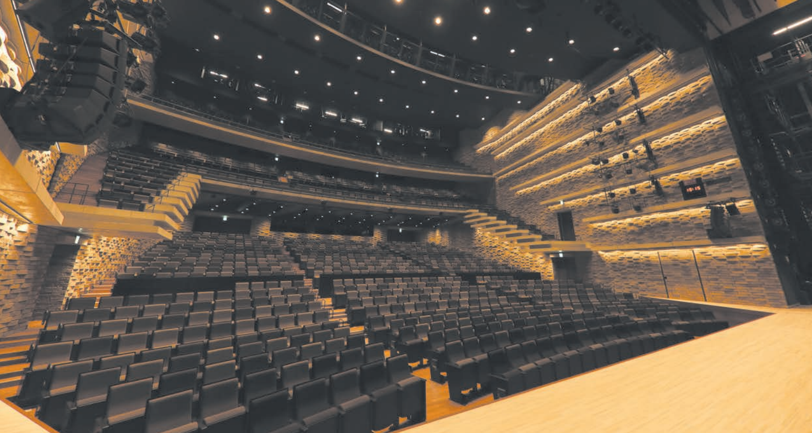
総合文化芸術センター関西医大 大ホールの舞台上から。1階から3階までの総客席数は1468席。