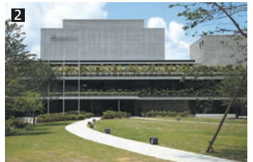
①広々としたエントランス。 ②枚方市駅すぐの正面入り口。