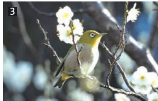
①公園の中央にある山田池。②枚方八景のひとつに数えられる山田池に映る月。③たくさんの野鳥が観察できるスポットとしても有名です。