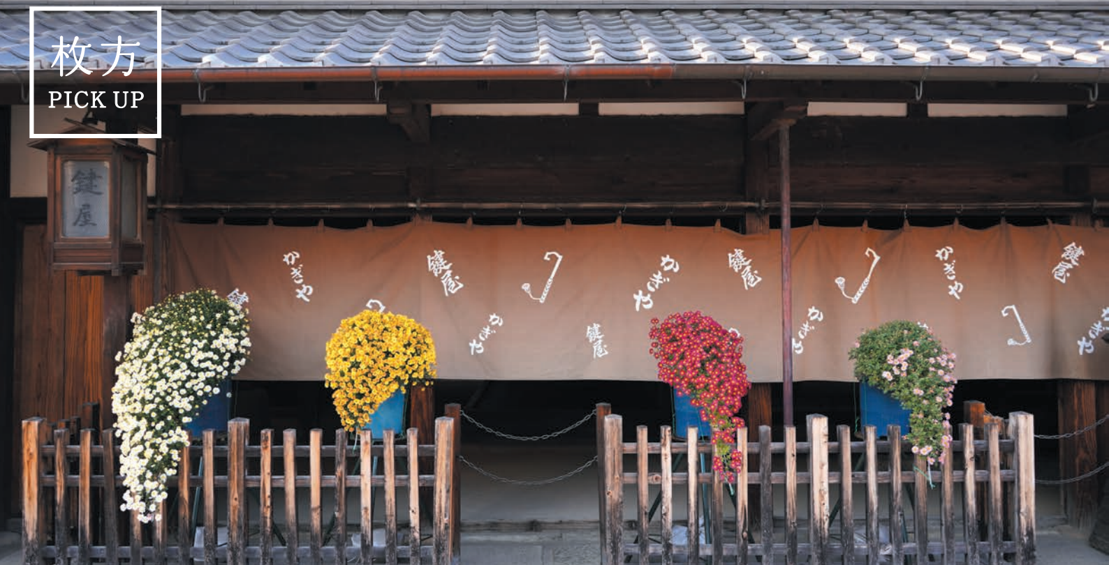
枚方宿街道菊花祭開催時の枚方宿鍵屋資料館の様子。市の花「菊」が情緒ある街並みと見事に調和しています。