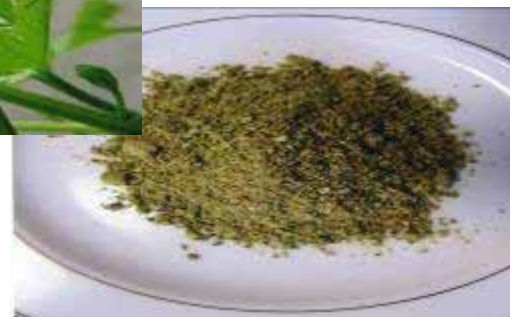
お茶用に粉末にしたゴーヤ