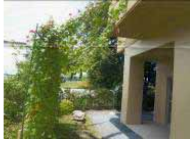
大潤会御殿山カーム