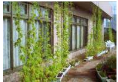
特定養護老人ホーム いこいの里